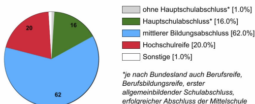
Ausbildungsbereich öffentlicher Dienst